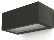
Isora Up-down rectangle