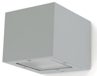
Isora Down square