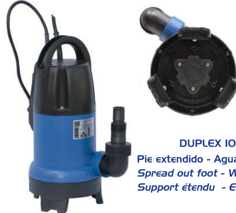
DUPLEX 100 AUT Pie extendido - Aguas residuales Spread out foot - Waste water Support étendu - Eaux résiduelles