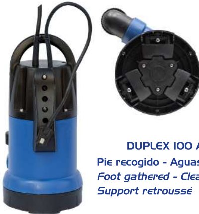
DUPLEX 100 AUT Pie recogido - Aguas limpias Foot gathered - Clean water Support retroussé - Eaux propres